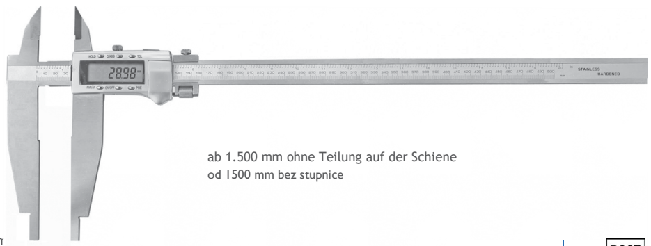
ab 1.500 mm ohne Teilung auf der Schiene od 1500 mm bez stupnice

= Speditionsware wegen Übergröße oder Übergewicht nadrozměr, dodání speciálním přepravcem