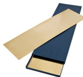
Breite 150 x 500 mm / šířka 150 x 500 mm VPE 5 St. / 5 ks