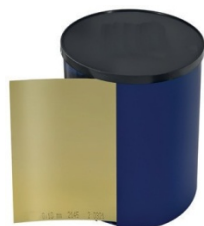
Breite 150 mm / šířka 150 mm Rolle á 5 m / role 5 m