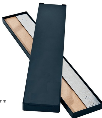
25 x 300 mm