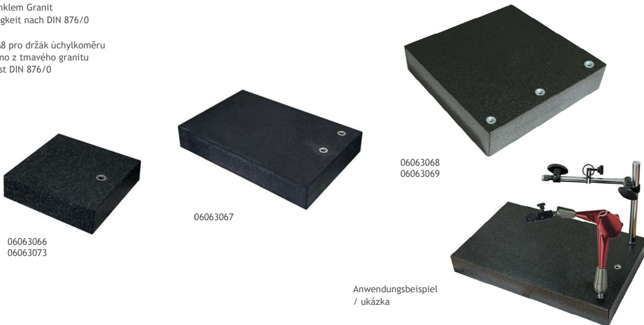
Anwendungsbeispiel / ukázka