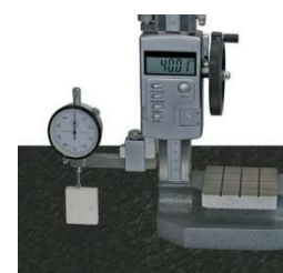
Anwendungsbeispiel / ukázka