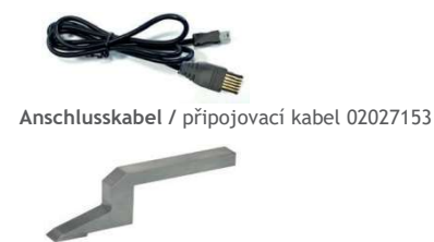
Ersatz-Anreißnadel / náhradní rýsovací jehla 02027152