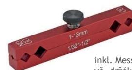
inkl. Messstift-Halter vč. držáku měřicích kolíků