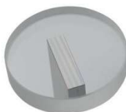
Beispiel / Příklad