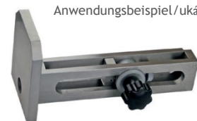
Anwendungsbeispiel / ukázka