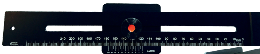
Nonius 1/20 mm odečet 1/20 mm