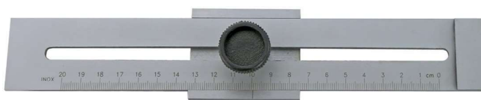
Nonius 1/10 mm odečet 1/10 mm