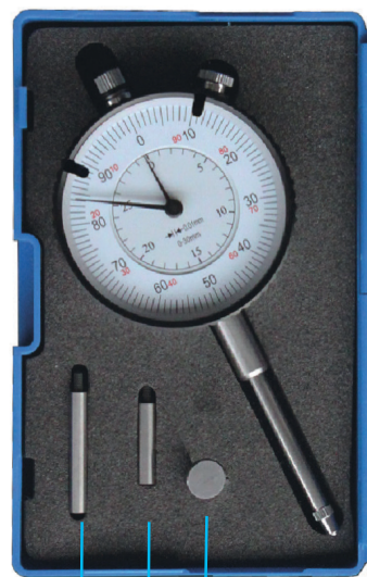
30 mm 20 mm 10 mm Ø Teller/talířek